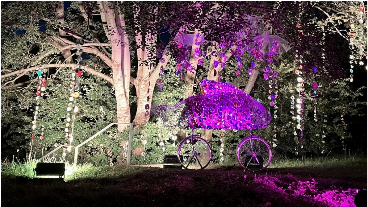
Dieser Fisch hat ein Fahrrad, und auch einen Baum mit vielen CDs: Werk „Regenbogenfisch“ von Feri Tabrisi.

Unter der künstlerischen Leitung von Feri Tabrisi war der Regenbogenfisch entstanden, der nun im Norderstedter Exil noch eine Art Begleitung bekam. Denn auf dem Hügel steht er direkt an einem Baum, den die Mitarbeiter des Norderstedter Gebrauchtkaufhauses Hempels ebenfalls in ein Kunstwerk verwandelt haben, indem sie ihn mit alten CDs behängt haben. So entstand ein beeindruckendes Monument, für viele Besucher ein weiteres Highlight des Rundgangs.