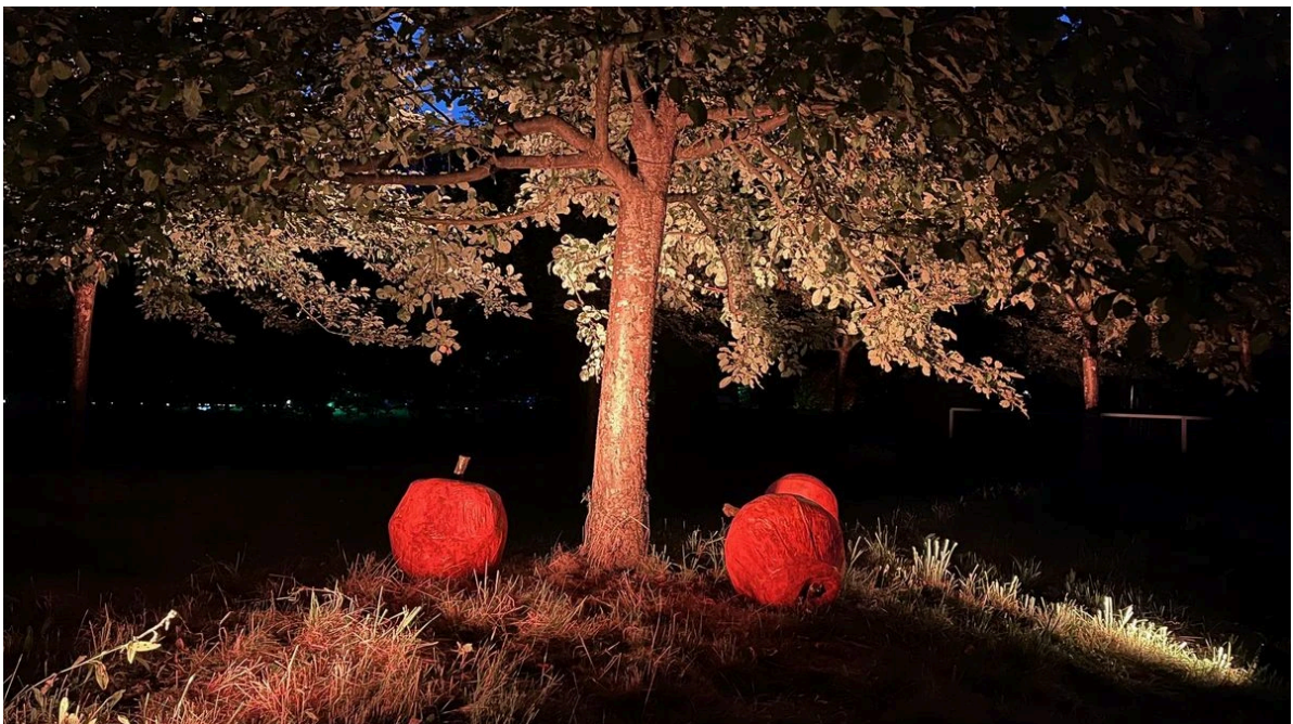
Übergroße Äpfel und mehr gab es auf der Obstwiese des Parks zu sehen.

„Die kreativen Sachenmacher“ gestalteten die Obstwiese um