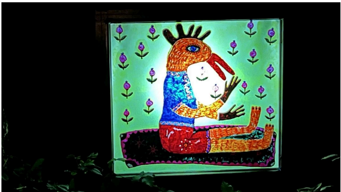
Farbenfrohe Überraschung zwischen Bäumen: Bild der Künstlerin Nataliia Reznichenko.