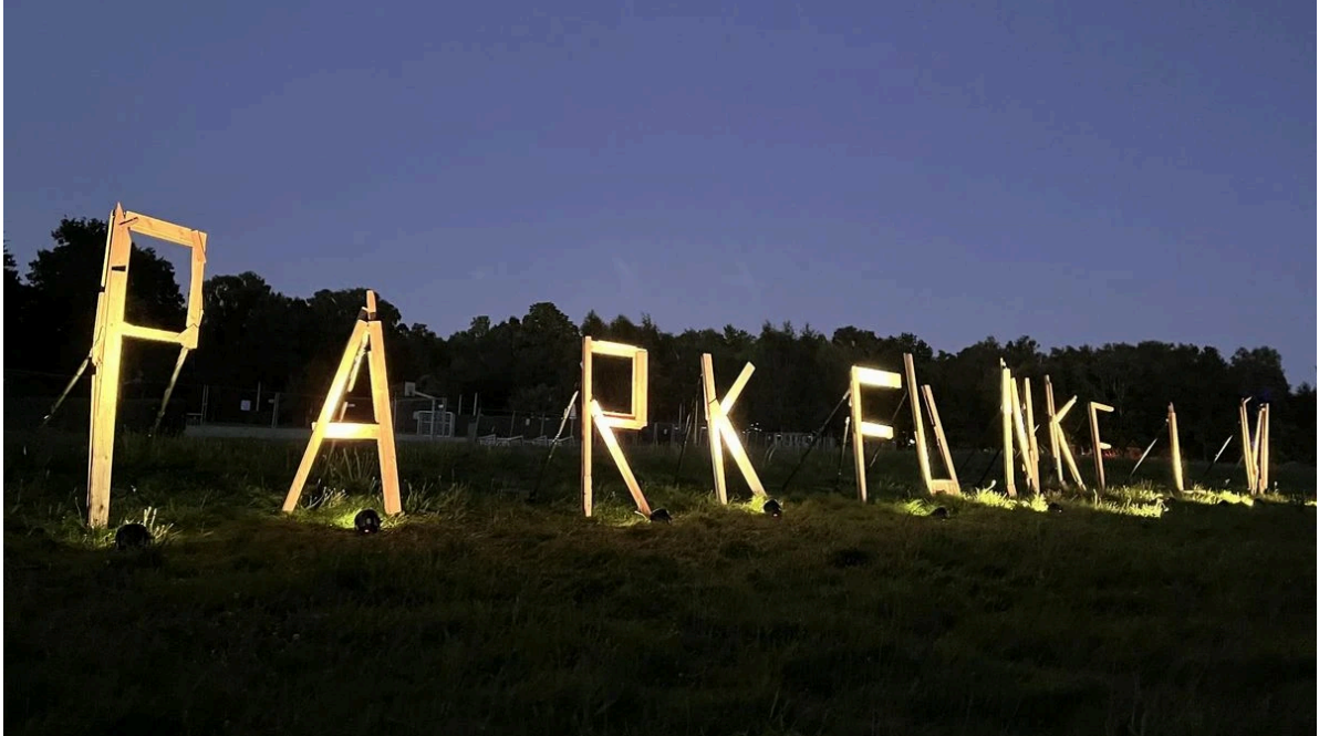
Auch ein Kunstwerk: ParkFunkeln-Schriftzug in Hollywood-Manier.