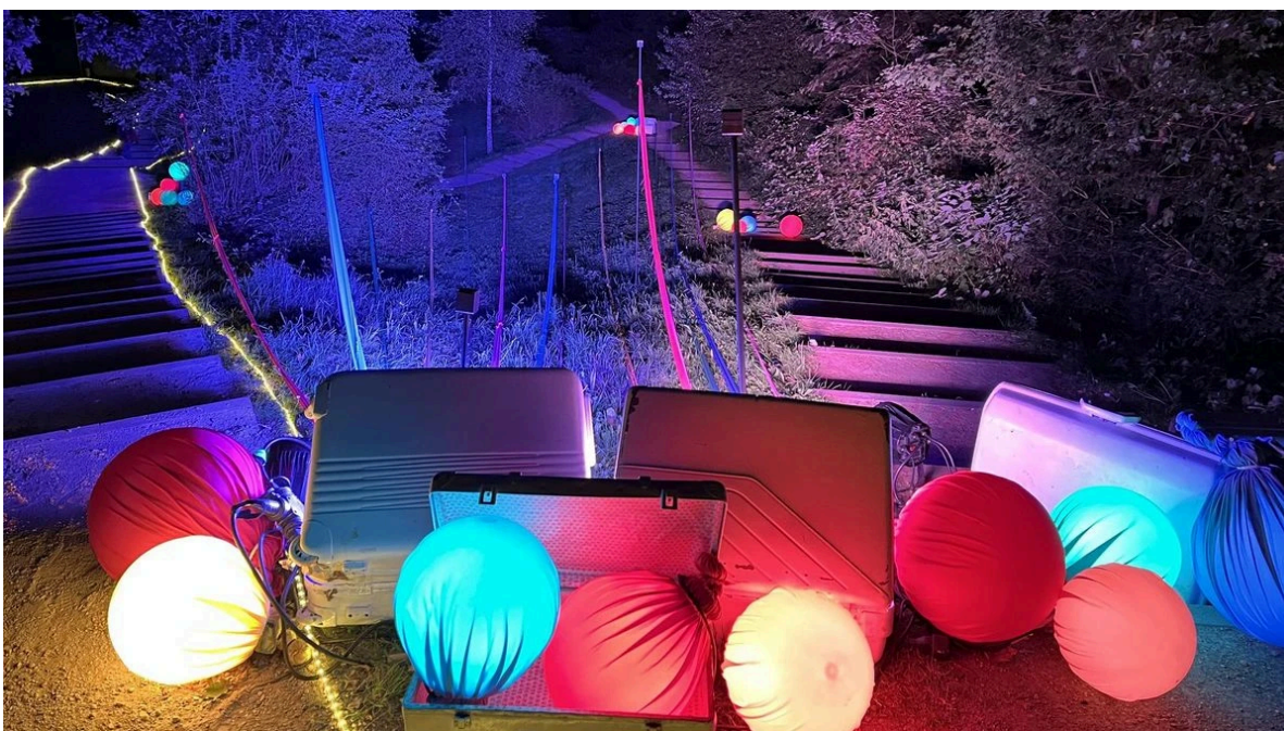
Das „ParkFunkeln Norderstedt 2025“ im Norderstedter Stadtpark: Illuminierte Kunstwerke inmitten der Natur.